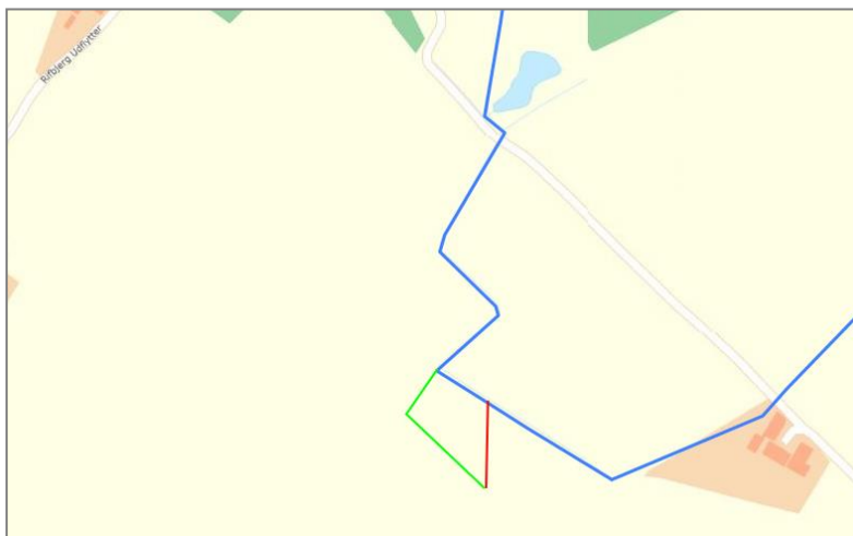
Figur 1. Bregnemoseafløbet (blå) med det oprindelige og nu nedlagte åbne tilløb (grøn), der i dag er rørlagt i nyt tracé (rød). Det er denne rødmarkerede rørlagte strækning, der nedklassificeres.

Hovedløbet udspringer i skel mellem matr.nr. 2h Kassebølle By, Simmerbølle og matr.nr. 8, Simmerbølle By, Simmerbølle ca. 78 m syd for disse to matriklers nordskel og forløber herfra med overvejende nordlig retning. Den rørlagte strækning slutter i skel mellem matr.nr. 18c og 18d Kassebølle By, Simmerbølle hvor vandløbet fortsætter i åben rende frem til udløbet i kysten.